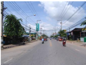
1.ภาพถ่ายสถานที่ใกล้เคียงด้านขวาของสถานที่ตั้ง