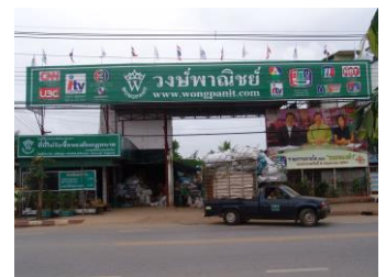
4.ภาพถ่ายของสถานที่ตั้ง