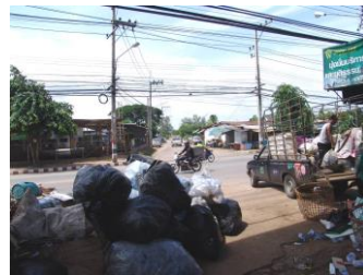
3.ภาพถ่ายฝั่งตรงข้ามของสถานที่ตั้ง